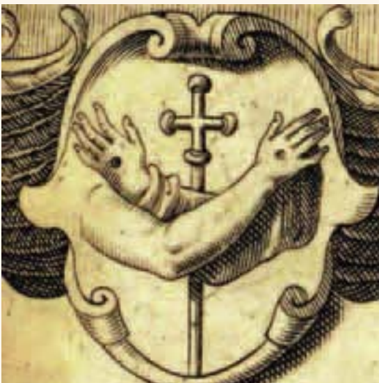
Stemma Semplice - incisione, 1594, Roma

francescano ha dato un impulso notevole, l'edizione del 1513 del celebre trattato di Bartolomeo da Pisa, De conformitate b. francisci ad vitam Domini Jesu Christi .