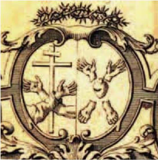
Stemma Bipartito - incisione, 1732, Amsterdam