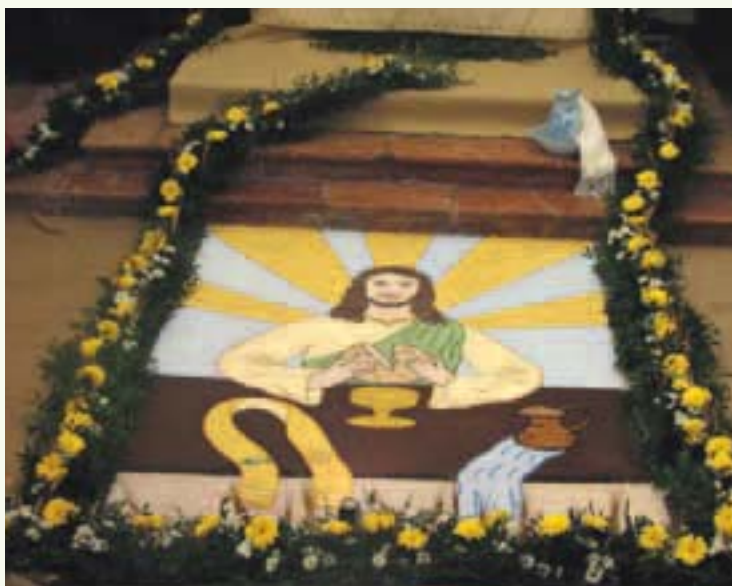
Decorazione floreale e addobbo dell'Altare della Reposizione