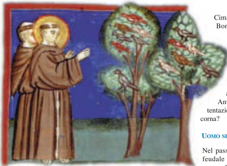
S. Buonaventura - Vita di San Francesco (Leggenda Mayor). S. Francesco parla agli uccelli. Miniature del XIII-XIV sec. Ed. Paoline 2006

finale prevalessse sul Cristo rifiutato e giudicato dall'uomo del primo Avvento. "L'Amore non è amato", soleva dire a tutti. E la croce da trono di gloria ritornerà ad essere lo storico patibolo riservato ai malfattori. Il Cristo re del primo millennio cristiano, spesso vestito di corona e colobion imperiale - "Guardo il crocifisso e vedo il Re", diceva Giovanni Crisostomo - diventa il Cristo beffeggiato di Cimabue ad Assisi e il Cristo contadino angariato di Donatello a Santa Croce francescana di Firenze. Spogliato dalla gloria divina nel farsi bambino a Natale, spogliato perfino dalla forma umana sulla croce: "Sono un verme, non uomo", il Dio minore di Francesco prende il cuore delle folle e affascina gli artisti. Per concomitanza di idee e immagini, anche Maria perde il suo solenne trono su cui siede nelle mille "Maestà" e appare con Gesù Bambino, in ginocchio e seduta per terra come nelle tante "Madonna dell'umiltà", tipiche degli ambienti degli Ordini Mendicanti. Nella crocifissione francescana, dovuta a Giotto, del transetto destro della chiesa inferiore di Assisi, Maria cade a terra, svenuta e assistita dalle Marie. Il teologo ortodosso russo Evdokimov è scandalizzato per la troppa umanità, per il troppo realismo dell'arte occidentale inaugurata da