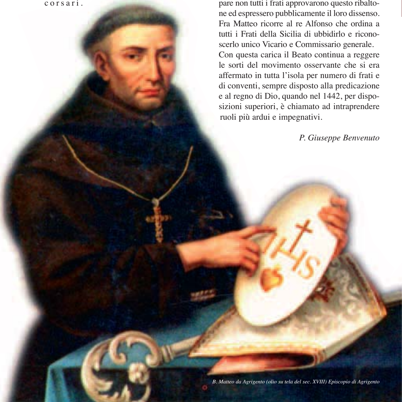
B. Matteo da Agrigento (olio su tela del sec. XVIII) Episcopo di Agrigento