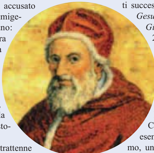
Papa Gregorio XIII