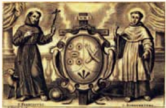
Stemma Tripartito - incisione, Seicento, Anversa