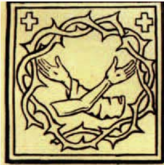
Stemma Semplice - incisione, 1736, Venezia