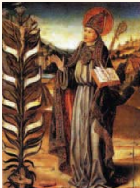
S. Bonaventura - Tavola anonimo fiammingo, fine Quattrocento - Fiandra

Gentile Frate Gesualdo le sarei particolarmente grata, se mi potesse dare informazioni". Rispondiamo al quesito postoci dalla signora Vitale, ma siamo lieti che abbiate accolto l'invito ad interagire con la redazione. Pace a voi.