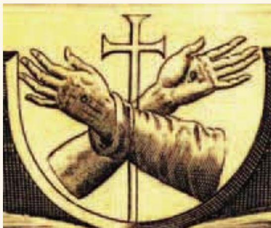
Stemma Semplice - Incisione di Carlo de Mallery - 1604 Parigi

però, sacrificò il chiaro segno impegnativo dell'inscindibilità del patto stabilito con Cristo a favore della singolare conformità di Francesco con il Salvatore, facendo di lui un "alter Christus". Per l'Ordine, il simbolo diventò celebrativo e, in molti casi, segno di gloria e onore. Allo sviluppo dello stemma